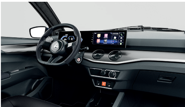
Tableau de bord « AIXAM digital cockpit »