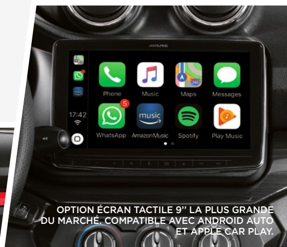
OPTION ÉCRAN TACTILE 9" LA PLUS GRANDE DU MARCHÉ. COMPATIBLE AVEC ANDROID AUTO ET APPLE CAR PLAY.