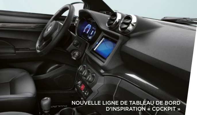
NOUVELLE LIGNE DE TABLEAU DE BORD D'INSPIRATION « COCKPIT »