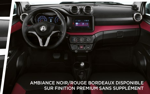
AMBIANCE NOIR/ROUGE BORDEAUX DISPONIBLE SUR FINITION PREMIUM SANS SUPPLÉMENT