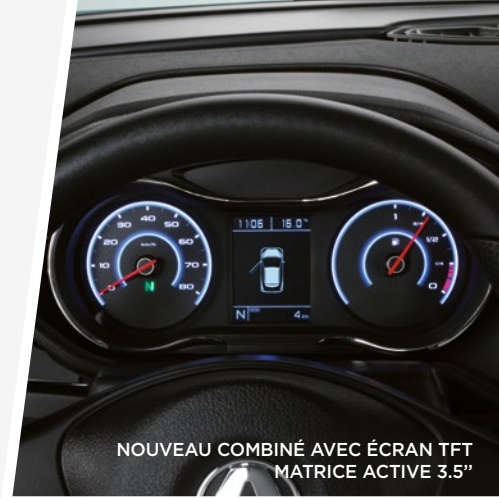
NOUVEAU COMBINÉ AVEC ÉCRAN TFT MATRICE ACTIVE 3.5"

01 - Bleu saphir / 02 - Blanc nacré / 03 - Rouge nacré / 04 - Bleu marine métallisé 05 - Gris argent métallisé / 06 - Gris titane métallisé / 07 - Noir métallisé 08 - Acier mat