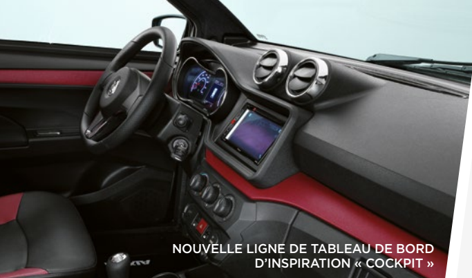
NOUVELLE LIGNE DE TABLEAU DE BORD D'INSPIRATION « COCKPIT »