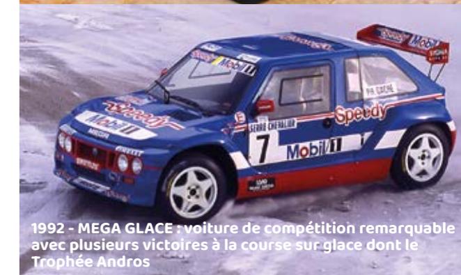
1992 - MEGA GLACE : voiture de compétition remarquable avec plusieurs victoires à la course sur glace dont le Trophée Andros