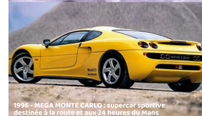
1996 - MEGA MONTE CARLO : supercar sportive destinée à la route et aux 24 heures du Mans