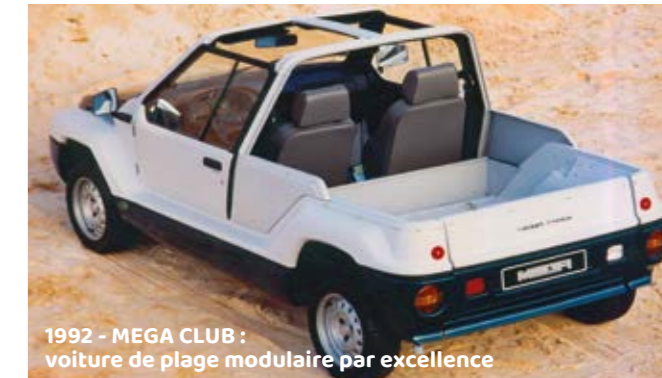
1992 - MEGA CLUB : voiture de plage modulaire par excellence