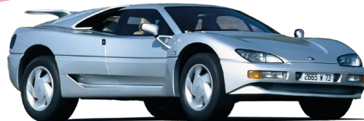
1992 - MEGA TRACK : mastodonte de haute technologie, mélange de 4x4 sportif et d'incroyable Supercar.