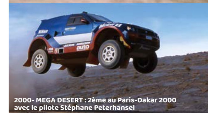
2000 - MEGA DESERT : 2ème au Paris-Dakar 2000 avec le pilote Stéphane Peterhansel